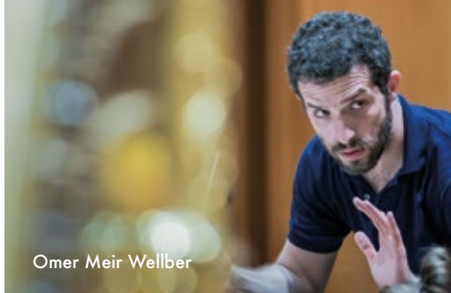
Omer Meir Wellber