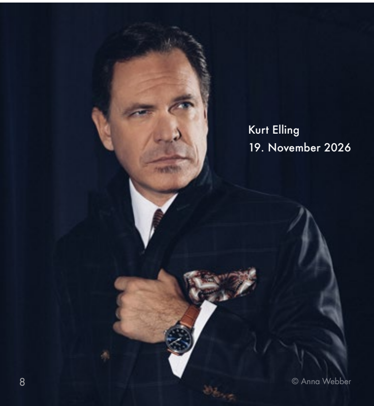
Kurt Elling 19. November 2026