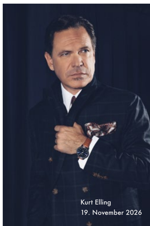
Kurt Elling 19. November 2026