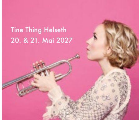
Tine Thing Helseth 20. & 21. Mai 2027