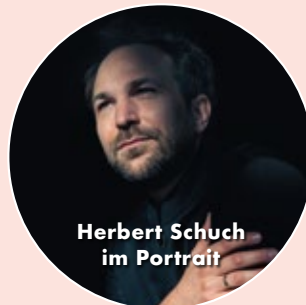
Herbert Schuch im Portrait

FREITAG | 15.00 | OHNE PAUSE 6 KONZERTE IM GROSSEN FESTSPIELHAUS INTERNATIONALE ORCHESTER & SOLISTEN IM GROSSEN FESTSPIELHAUS