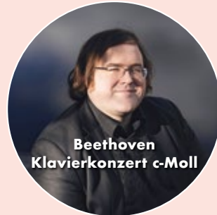
Beethoven Klavierkonzert c-Moll