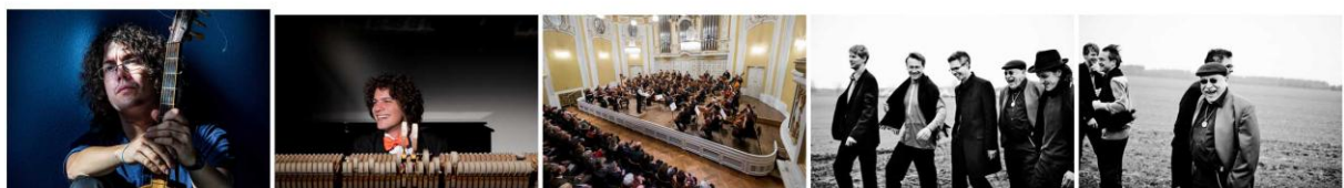
EnrikeSolinis.jpgFabioMartino.jpgFaschingsmatinee_2018_HelmutZei... GioaraFeidman_GitanesBlondes-1... GioaraFeidman_GitanesBlondes-2 ...