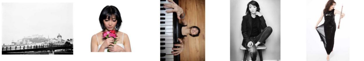
Camerata_AmMarkatsteg-2 © PiaC... Claire_Huangci © CH.jpg ClaireHuangci © AndreasFleck.jpgClaireHuangci ©ClaraDent-1 © GudrunWesp.jpeg