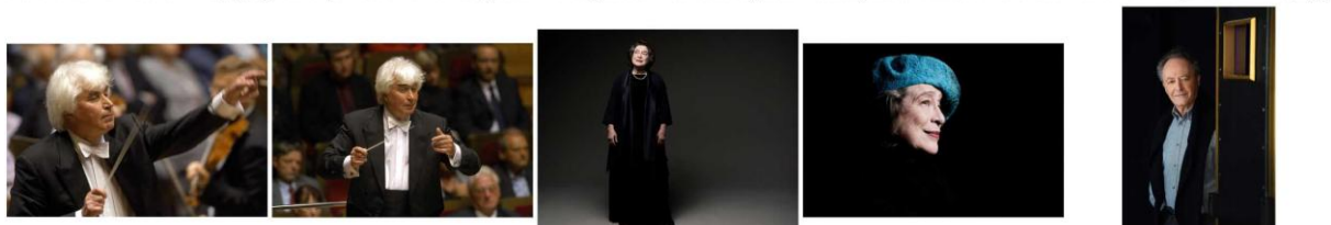
DimitrijKitajenko-1 © GerdMothes.jpgDimitrijKitajenko-2 © GerdMothes.jpg ElisabethLeonskaja-1 © MarcoBorg... ElisabethLeonskaja-2 © MarcoBorg... EmmanuelKRIVINE © Radio France...