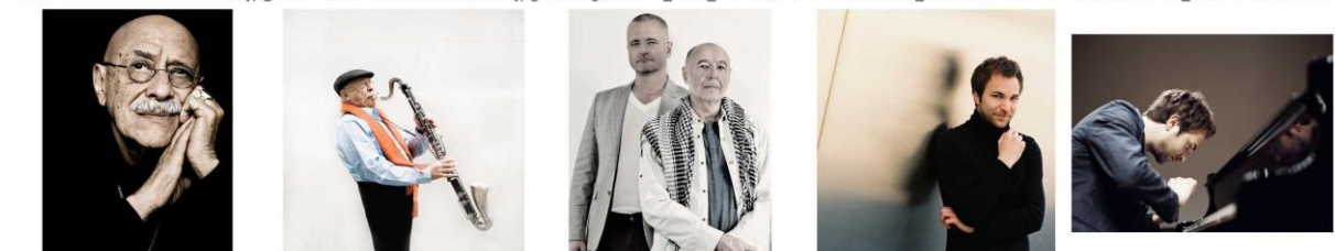
Giora_Feidman © FelixBroede.jpg GioraFeidman_BassKlarinette © Fe... HerbBerger_WilliResetarits © Eva... HerbertSchuch-1 © FelixBroede.jpgHerbertSchuch-2 © FelixBroede.jpg