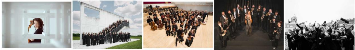
AnastasiaKobekina © EvgenEvtyuk... Bachchor © Bachchor_AndreasHe... BBC_ScottishSymphonyOrchestra... BSO_Silvestergala © BSO.jpg Camerata_AmMarkatsteg-1 © PiaC...

Honorarfreie Fotos, das Jahresprogramm und die Pressemappe stehen zum Download bereit unter: https://bit.ly/2NvT502