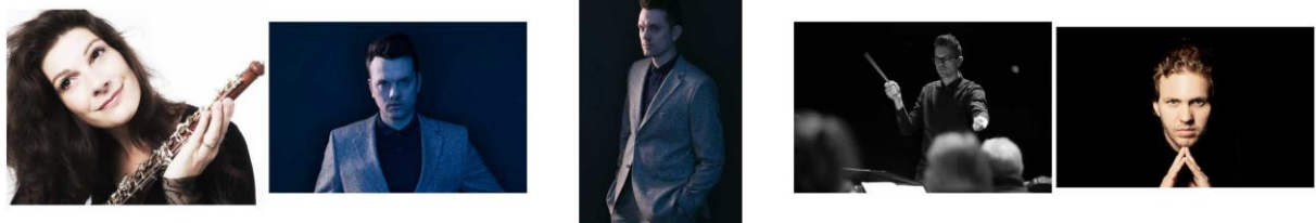
ClaraDent-2 © GudrunWesp.jpeg DanielBjarnason-1 © BörkurSigtho... DanielBjarnason-2 © BörkurSigtho... DanielBjarnason-Probe © BörkurSi... DavidDanzmayr ©Danzmayr.jpg